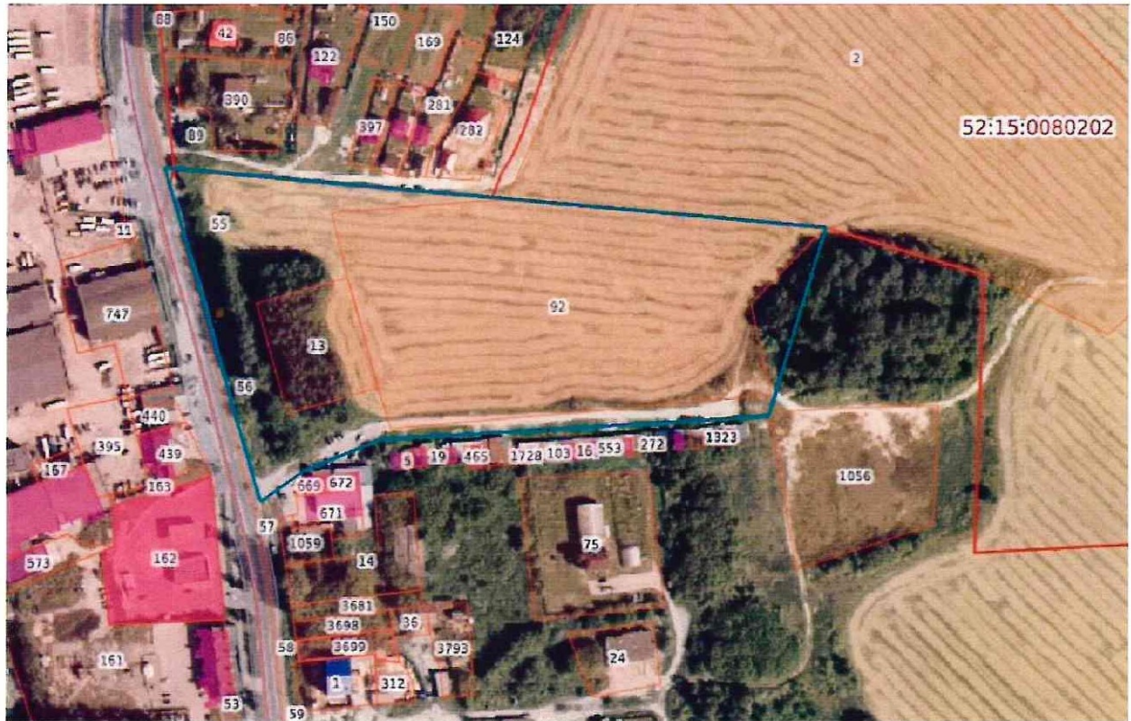
Схема границ подготовки инженерных изысканий

Генеральный директор ООО «НПЦ «Развитие Региона»